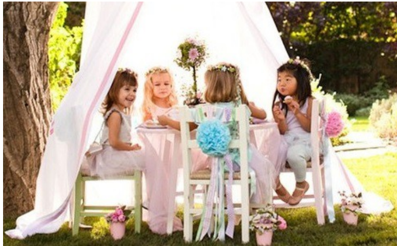
Vaikučių virtuvėlė „Namų dvasia“, Vilnius VAIKŲ ŠVENTINIO STALO PASIŪLYMAS

UAB "Namų dvasia" į/k 302689390 Buveinės adr.: Kalvarijų g. 88, Vilnius, Lietuva Tel.: 868637351 El. paštas: namudvasia@gmail.com www.namudvasia.lt